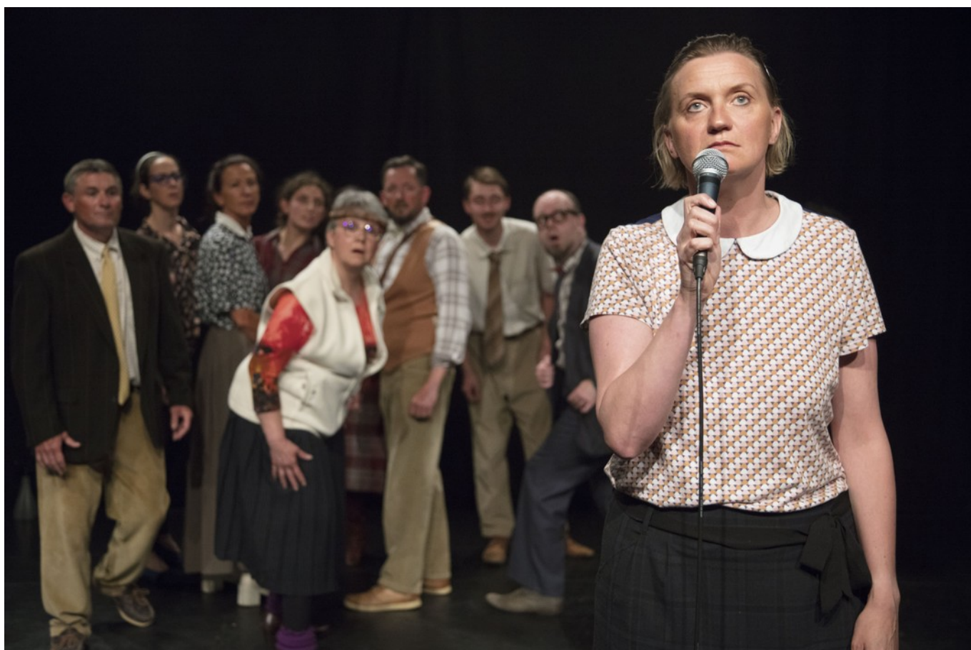
Mes frères et sœurs atomiques – Mise en Scène Alexandre Serrano