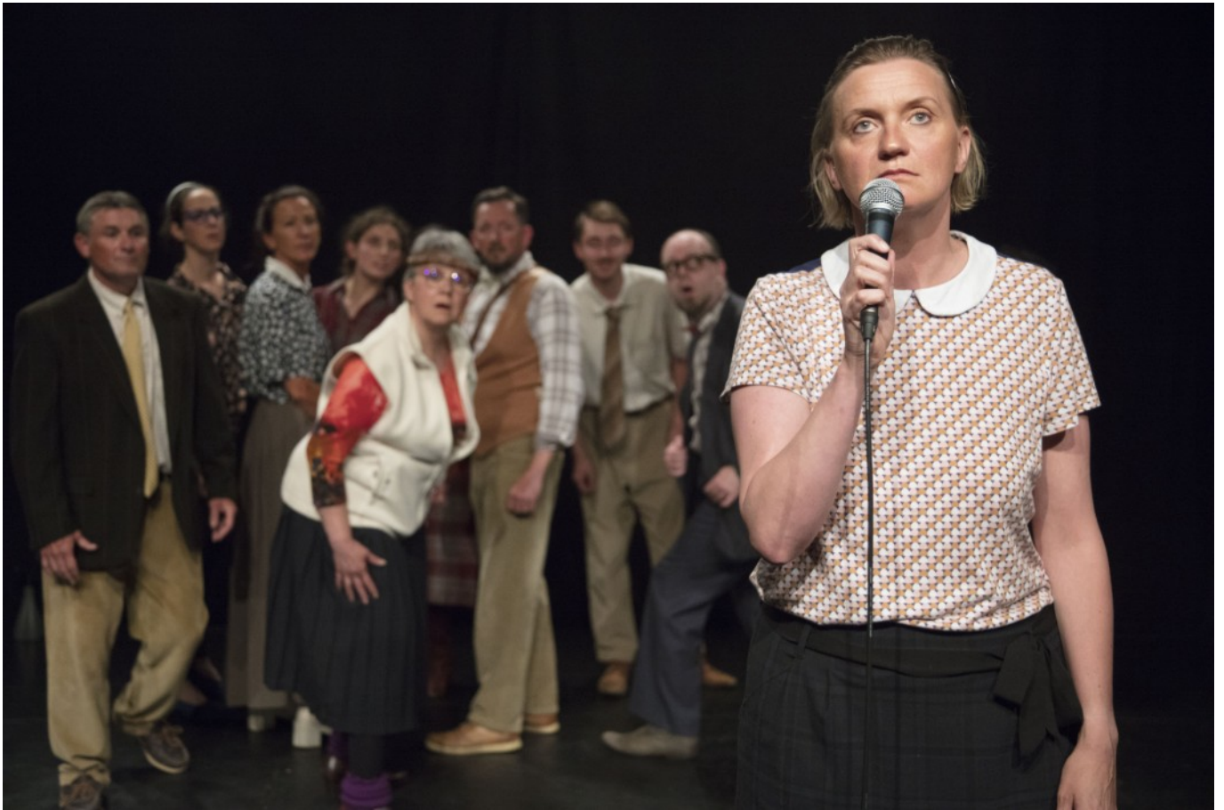
Mes frères et sœurs atomiques – Mise en Scène Alexandre Serrano